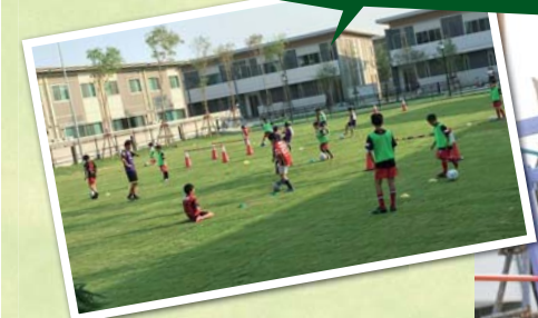
Soccer school 週3回行われるサッカーズクール。サッカー好きの男の子が集まり、汗を流しています。