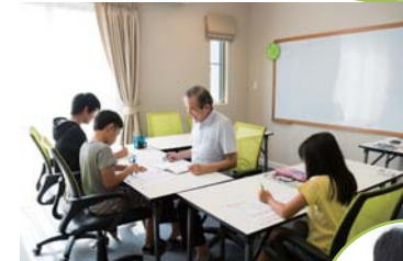
シラチャゼミは、敷地内の一室で開催されている塾。勉強も遊びも思いっきり！です。