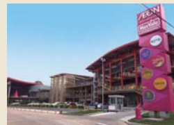
イオンショッピングセンター

300 ヤードのゴルフ練習場のほか、フットサルコート、ビリヤード、カラオケボックス、タイマッサージ、レストランなどの施設が入っています。