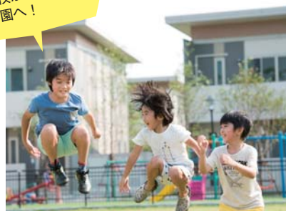
「今日はどこで遊ぶ?」。遊び場がたくさんあるのも、ハーモニックレジデンス シラチャならではの。子どもたちだけで行動できる敷地内の環境は安心、安全です。